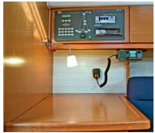
Die Navigation ist auf einen kleinen Kartentisch am Ende des Salonsofas geschrumpft.

Sehr angenehm gestaltet sich auch das Gefühl am Ruderrad: Es liegt gut in der Hand – nicht zu schwer- und nicht zu leichtgängig – und erlaubt, die Yacht mit nur wenigen gezielten Steuerimpulsen problemlos im Griff zu behalten. Selbst bei stärkerer Krängung in Böen oder wenn der Bug doch einmal von einer etwas größeren Welle weggedrückt wird, kann man die Cruiser 32 mit einer Handbewegung wieder auf Kurs bringen. Das offenbar perfekt ausbalancierte Ruder sorgt für unbeschwertes Segelvergnügen. Dass die Yacht selbst beim absichtlichen