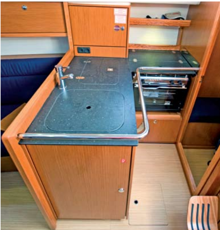
Die Pantry lässt in puncto Ausstattung nichts zu Wünschen übrig – auch wenn der Stauraum für „Pött und Pann“ etwas knapp ausfällt.

einem 1,95 Meter tiefgehenden Guss-eisenkiel steckt (Standardversion, optional ist auch eine Flachkielvariante erhältlich). Hinzu kommt die ebenfalls zur Steifheit beitragende Rumpfform.