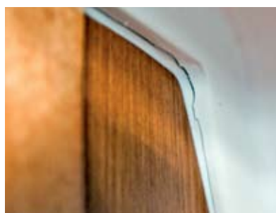
Verbesserungspotenzial: eingerissene Fuge am Hauptschott und rechtscharfkantige Winkel am Handlauf der Pantry.

Die Vorsegel-Winschen liegen zwar nicht unbedingt in direkter Griffweite des Rudergängers – die Schotführung sorgt aber ebenfalls für eine kräfteschonende Bedienung. Und zumindest zum Losschmeißen langt auch der Steuermann allemal heran. Zumal die Yacht dank ihres gutmü-