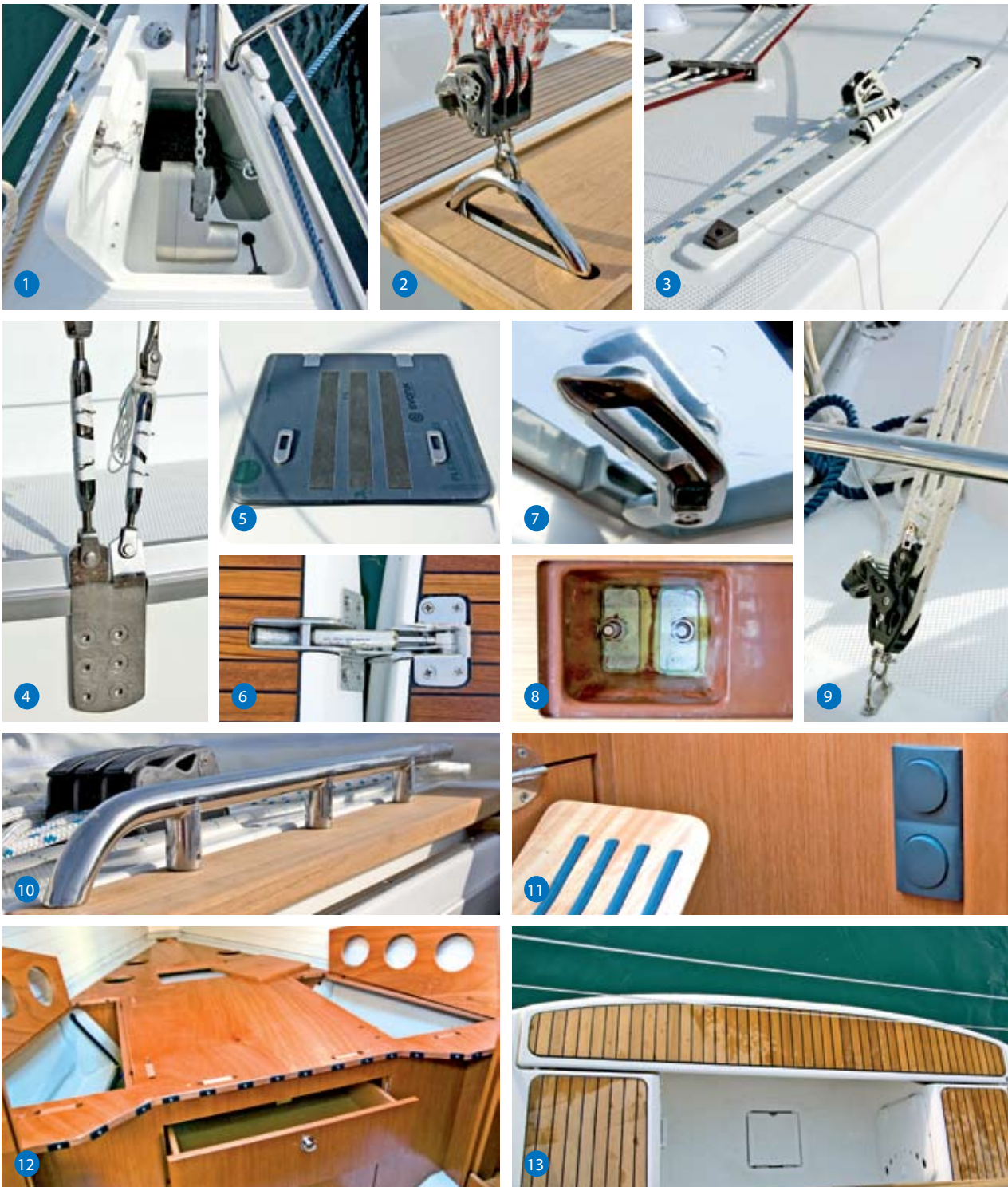
Details: 1. Ankerkasten mit verdecktem Spill (Extra), 2. Großschotbügel am Cockpittisch, 3. Holepunktschienen auf dem Kajütdach, 4. an den Rumpfgebolzte Wanten-Rüsteisen, 5. Flushluks, 6. ausgeklügelte Badeplattformaufhängung mit integrierten Gasdruckfedern, 7. Metallbeschläge an den Decksluken, 8. Kielbolzenverankerung, 9. gut untersetzte Achterstags-talje (Extra), 10. Edelstahlhandläufe am Niedergang, 11. Lichtschalter neben dem Niedergang, 13. gut organisierte Stauräume, 14. Steuermannsducht bei hochgeklappter Badeplattform (davor die Zugangsklappe zum Ruderquadranten).

Ansonsten bietet die äußere Erscheinung kaum Reibungspunkte. Die Schlichtheit des Designs und die schlüssige Formensprache erscheinen zeitgemäß – allerdings wirkt das neue Modell aufgrund des hohen