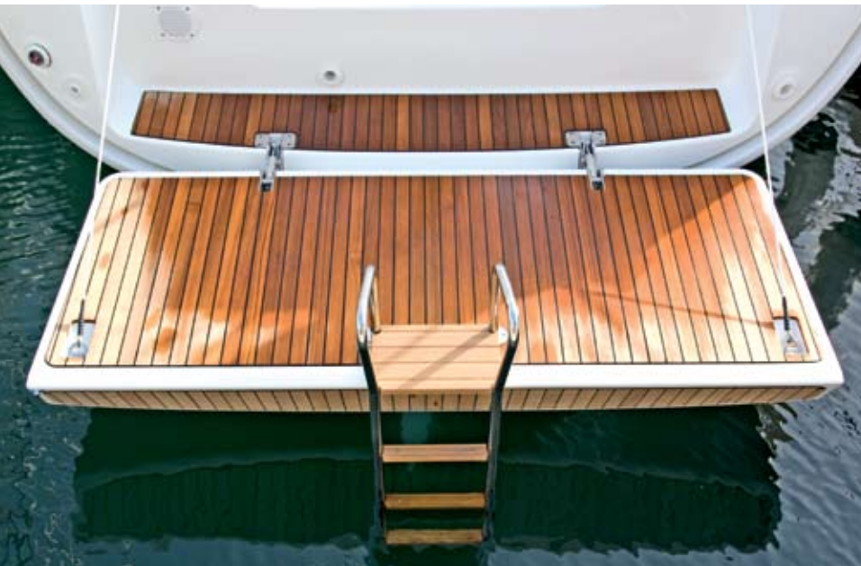
Ein herausragendes Designelement der neuen Cruiser 32 bildet die riesige von Handausklappbare Badeplattform, an deren Ende eine schöne Edelstahlleiter mit Teakprossen eingehängt wird.

Als Extra ist ebenso eine Großsegelrollanlage erhältlich (Mastrollsystem, 2.570 Euro) – die Vorsegelrollanlage gehört indes zur Grundausstattung.