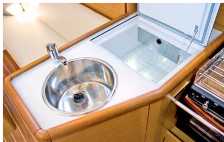
Die Pantryausstattung lässt gleichsam keine Wünsche offen, legt mit ihrer standardmäßigen 100-Liter-Kühlbox sogar Maßstäbe vor.

Somit verspricht die Werft durchaus nicht zu viel, wenn sie auf einen trotz allem Komfort „kompromisslos auf die seglerischen Qualitäten“ ausgerichteten Riss verweist. Denn gerade die Leichtwindeigenschaften und die unter solchen Bedingungen erzielbare Höhe am Wind verraten viel über das seglerische Potenzial eines Risses – bei Starkwind im