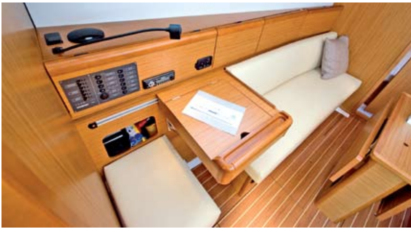
Der verschiebbare Kartentisch bietet in seiner „Arbeitsposition“ einen absolut funktionstüchtigen Navigationsbereich mit Sitzplatz in Fahrtrichtung.

stattdessen den optionalen Traveller ordern, der ungefähr auf mittlerer Höhe des vorderen Cockpitbereichs am Boden montiert wird. Er bietet damit eine ausreichende Länge für spürbare Trimmanpassungen und zudem einen deutlich günstigeren Großschotholepunkt. Die gut untersetzte Großschottalje mit Feineinstellung hält zugleich den erforderlichen Kraftaufwand in moderaten Grenzen. Was ebenfalls für die Travellervariante spricht, ist die Tatsache, dass auf dem Kajütdach neben dem Niedergang an Steuerbord ein Decksluk eingelassen und daher selbst optional keine zweite Arbeitswisch vorgesehen ist – laufen Großschot, Fallen, Strecker und Reffleinen jedoch über die gleiche Wisch, kann es beispielsweise beim Reffen knifflig werden, alles gleichzeitig unter Kontrolle zu behalten.