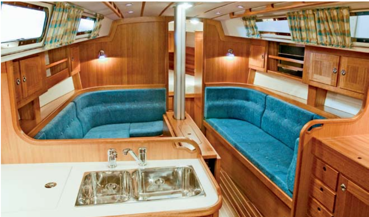
Das Interieur der SwedeStar präsentiert sich in bester schwedischer Bootsbautradition – in gediegenem Abiente, makellos verarbeitet und zugleich rundherum seetauglich. Die Werft lässt dem Kunden zudem Spielraum für eigene Gestaltungsideen.

Personen niederlassen – die Doppelkoje bietet eine Länge von 2,03 Metern bei einer Breite zwischen 1,70 und 1,10 Metern. Ein großzügiger Kleiderschrank stellt Mitseglern außerdem ausreichend Stauraum zur Verfügung. Gut gelöst wurde der in der Achterkammer untergebrachte hintere Zugang zum Motor, so dass sich auch Elemente außerhalb des Niedergangsbereichs problemlos warten lassen.