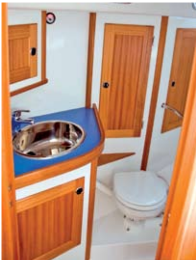
Ein kleines Highlight repräsentiert die sehr gelungene Nasszelle.

Lediglich im Raumgang scheint es noch etwas mehr „Schiebewind“ zu brauchen – mehr als 4,1 Knoten sind bei 150 bis 160 Grad unter den Leichtwindbedingungen des Testtages nicht drin. Dafür fehlt es auf der Testyacht auch schlicht an einer angepassten Besegelung, denn für solche Kurse stellt eine Selbstwendefock unter diesen Rahmenbedingungen nun einmal keine optimale Wahl dar (immerhin vermeidet die standardmäßig versenkte Rollanlage etwaige Verluste im Unterliekbereich). Käufern empfiehlt es sich vor diesem Hintergrund, den optionalen Gennaker gleich mitzuordern (Aufpreis: 2.050 Euro, alternativ ist auch ein Spinnaker erhältlich) – einer weit überlappenden Genua dürften derweil die außen ansetzenden Püttinge entgegenstehen. Diesbezüglich sieht die Werft als Alternative zur Selbstwendefock daher auch lediglich eine 108-Prozent-Genua vor (Aufpreis: 2.745 Euro), wobei die zugehörigen Holeypunktschienen und Schotwischen allerdings bereits in der Standardausstattung enthalten sind.