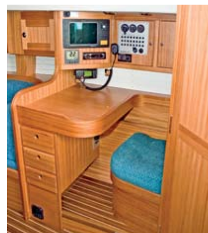
Die L-förmige Pantry bietet alles, was das Smutje-Herz begehrt. Hinzu kommt eine vollwertige Navigation (serienmäßig mit Stehplatz, auf Wunsch auch mit Bank).