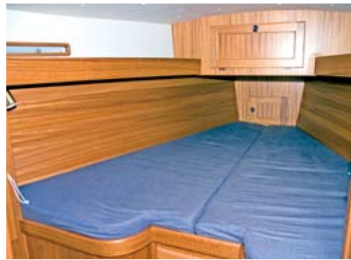
Im Bugbereich befindet sich eine komfortable Eignerzimmer mit großer Doppelkoje und sehr viel Stauraum.

Diese großen Differenzen zeigen, dass wir uns während des Tests offenbar genau in dem „Windfenster“ bewegten, welches bei dieser Yacht die Grenze zwischen gemächlichem Trott und ordentlichem Vortrieb markiert. Mit ihrem soliden Gewicht bei gleichzeitig recht moderater Standard-Segelfläche aus teilgelattetem Großsegel und Selbstwendefock braucht sie erwartungsgemäß eben einfach ein gewisses Lüftchen, um richtig anzuspringen. Dafür können sich die dann erzielten Werte durchaus sehen lassen. So machen wir die größte Höhe unter den bereits angeführten 5,7 Knoten