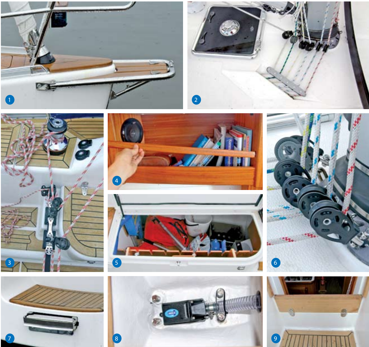
Details: 1. Bugplattform und versenkte Vorsegel-Rollanlage; 2. Fallenführung unter Deck; 3. eigenwillige Großschotführung; 4. wegnehmbare Schlingerleisten; 5. geräumige Backskiste; 6. kugelgelagerte Blöcke; 7. Badeleiter-Garage im Heckspiegel; 8. ordentlicher Bilgensumpf; 9. Flutschutzklappe vor dem Niedergang.

man uns in alle Produktionsbereiche, um uns ein eingehendes Bild von der handwerklichen Kompetenz und Qualität machen zu können. Der Rumpf wird ebenso wie das Deck als Sandwichkonstruktion mit einem 20 Millimeter starken Kern aus Balsaholz gefertigt – eine Konstruktion, die für eine hohe Festigkeit bei vergleichsweise geringem Gewicht und guten Isoliereigenschaften sorgen soll. Als Verstärkungsmaterial kommen multiaxiale Gewebe zum Einsatz – gleichsam mit der Zielsetzung eines hochfesten und dennoch leichten Bauteils. Während man für das Rumpflaminat zeitgemäße Isophthalsäureharze