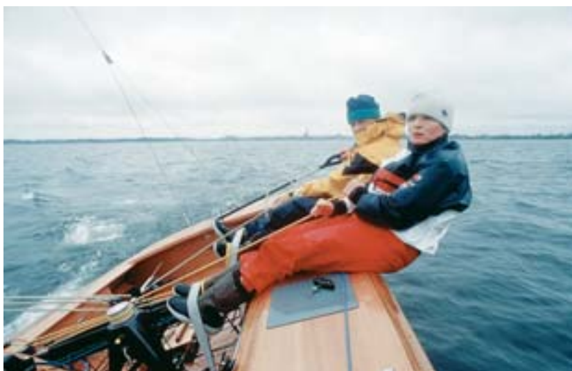
Der Vorschoter pumpt mit der Leine die Genua dicht, dabei wird das Schiff wie eine Jolle ausgeritten