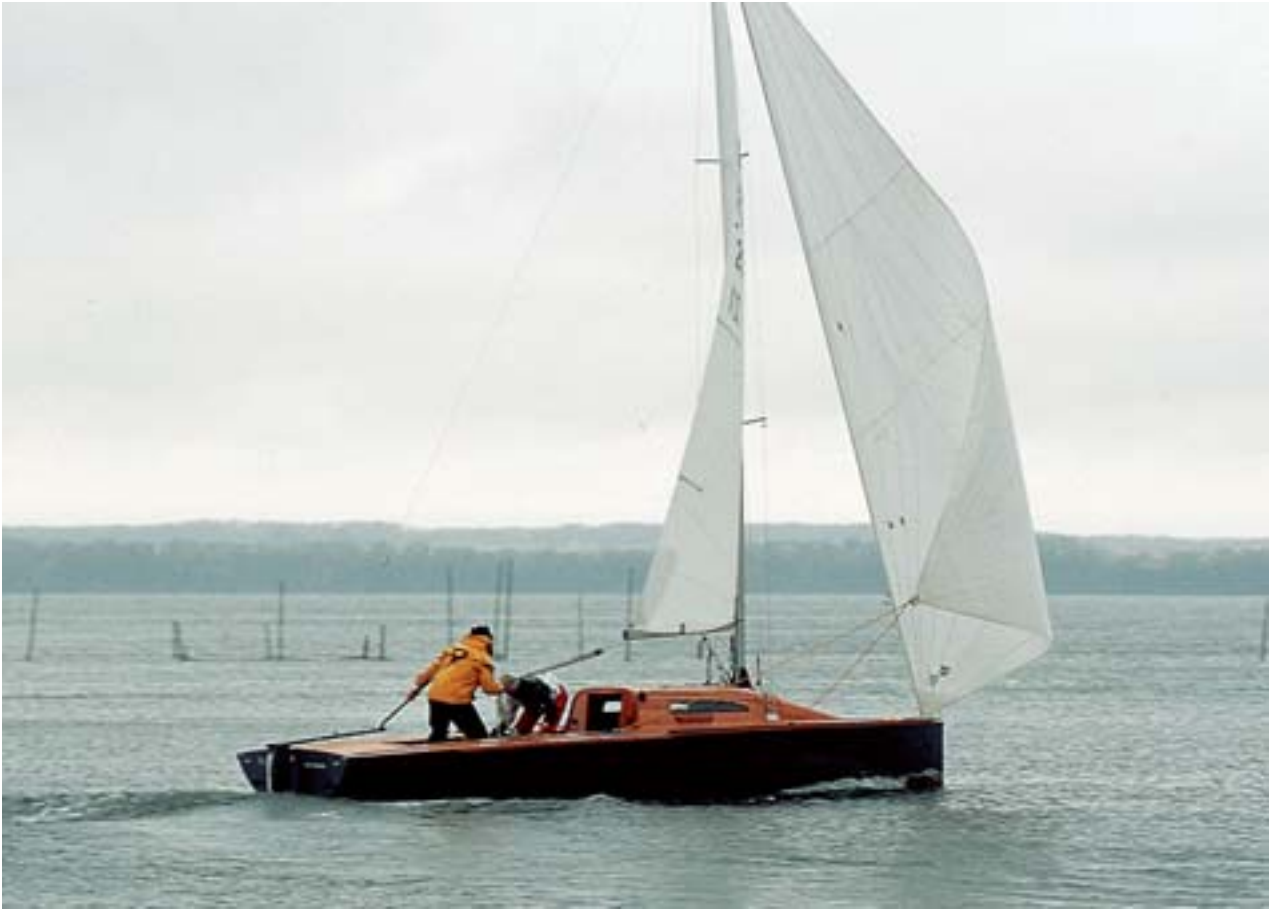
Der Jollenkreuzer – ein anspruchsvolles Regattaschiff, das sich auch zum Tourensegeln eignet