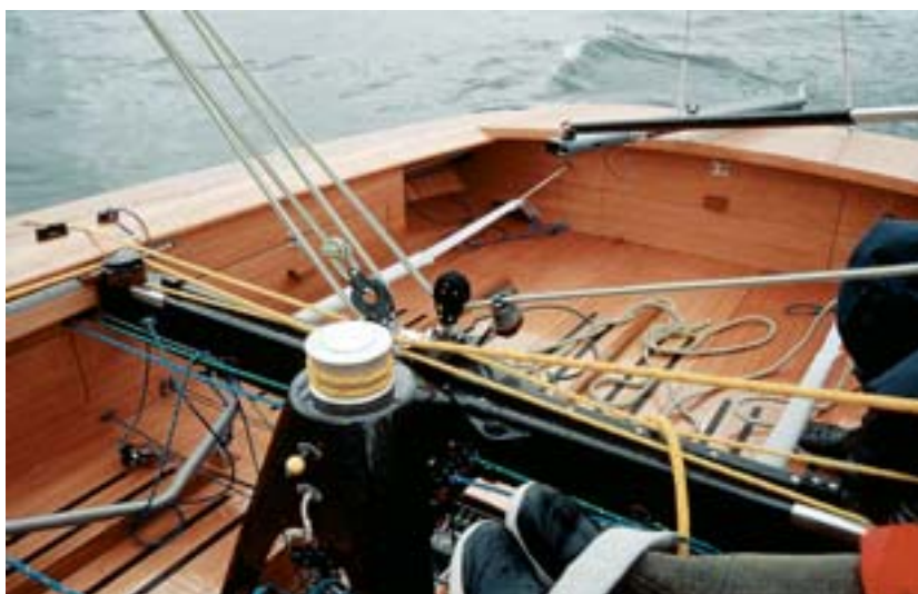
Die meisten Strecker laufen am Kohlefaservertraveller zusammen. Die Genuawinsch in der Mitte wird über Leinen, die auf die Seitendecks laufen, bedient

Bevor wir losfahren, muss das Boot ins Wasser gelassen werden. Dann verholen wir es von Hand zu einem Liegeplatz ins Freie, um den Mast zu stellen. Da an unserem Testboot kein Außenborder angebracht ist, ►