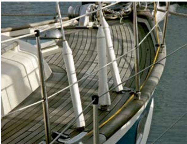
Die Rumpf-Deck-Verbindung wird durch den massiven Teak-Süllrand wirkungsvoll geschützt, die Relingstützen oben auf sind solide verankert