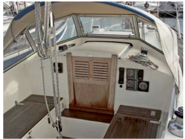
Das Cockpit bietet ausreichend Platz für vier Segler, hinter der festen Scheibe bleibt es lange trocken. Viele Exemplare verfügen über eine Kuchenbude

zelle mit Dusche, die nicht mehr über die ganze Schiffsbreite reicht wie beim Vorgängermodell. Beiden Varianten gemeinsam sind Rumpf und Rigg sowie eine ganz auf das Fahrtensegeln zugeschnittene Inneneinrichtung.