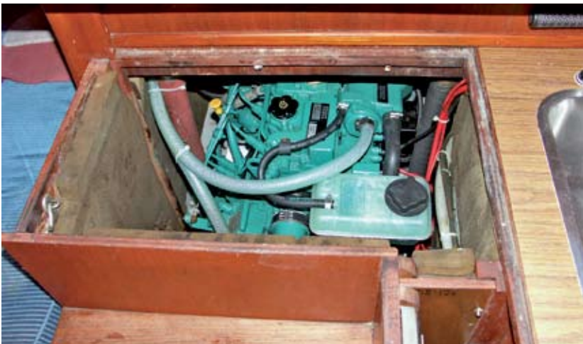
Die Maschine sitzt unter dem Niedergang. Der Zugang ist etwas eng, kann aber durch eine etwas umständliche Demontage der Verkleidung vergrößert werden