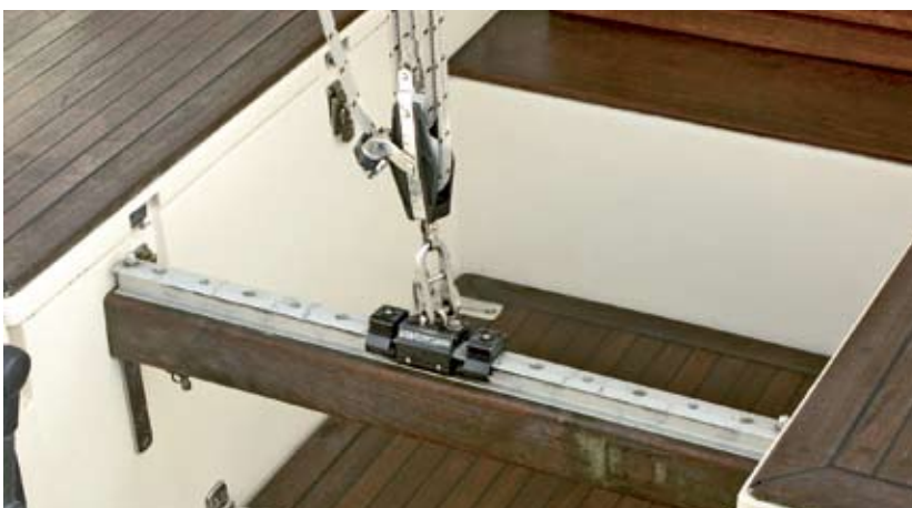
Der Traveller ist für wirkungsvollen Trimm zu kurz und sorgt schnell für angeschlagnene Schienbeine. Fahrtensegler können durchaus darauf verzichten

Unter Deck ist das Schiff mit Vinylbezügen und hellen Paneelen verkleidet, die zwecks Kontrolle der Decksbeschläge demontiert werden können. Die Rumpfsseiten verfügen über eine Wegerung aus Holzlaten, dies hält Kondenswasser von Bettzeug und Polstern fern. Drei große Klappluks, über dem Vorschiff, der Nasszelle und dem Salon angeordnet, sowie zahlreiche Lüfter sorgen für ein gutes Klima ▶