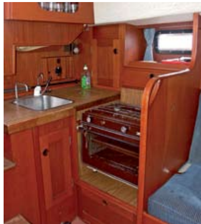
Die Schiebepantriebe sind gut gelagert und verschwinden bei Nichtgebrauch unter der Cockpitducht, für Pötte und Pann ist ausreichend Stauraum vorhanden

unter Deck. Dessen Sandwich-Konstruktion dämmt den Innenraum wirkungsvoll gegen Schall- und Temperatureinflüsse.