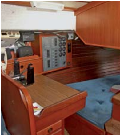
Alle Kojen haben ausreichende Liegelänge, die Schapps darüber sind mit Riegeln gesichert. Zum Schlafen werden die Rückenlehnen hochgeklappt