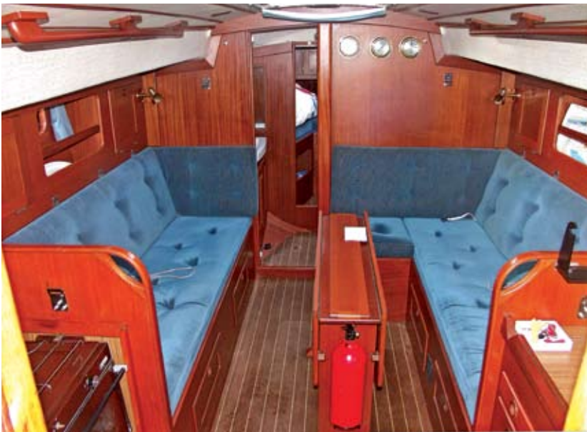
Typisch Hallberg-Rassy: Warme Holzöne kontrastieren mit den weißen Flächen der Deckenverkleidung. Das Schiff ist für den Gebrauch auf See sinnvoll aufgeteilt, Stauraum gibt es überdurchschnittlich viel. Durch lange Handläufe kann man sich auch bei ruppigem Wetter sicher bewegen