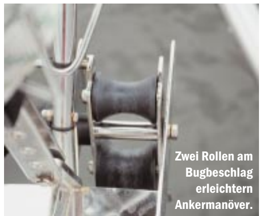
Zwei Rollen am Bugbeschlag erleichtern Ankermanöver.