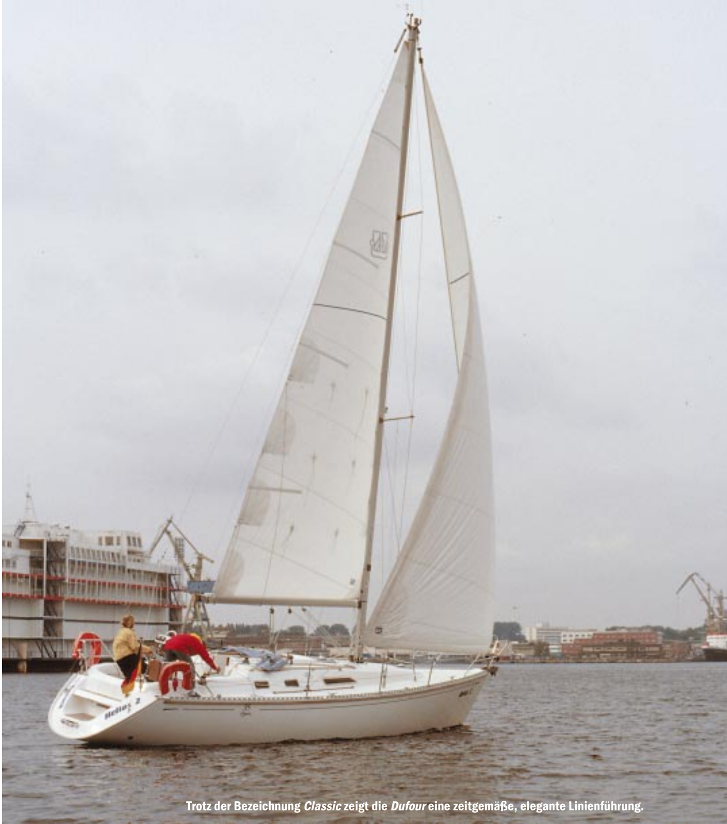
Trotz der Bezeichnung Classic zeigt die Dufour eine zeitgemäße, elegante Linienführung.

ein Abstand von 83 Zentimetern: Zum aufrechten Sitzen reicht das nicht aus.