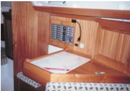
Der Navigationstisch ist groß genug, um mit Sportbootkarten daran zu arbeiten.

Koje ist der Wassertank untergebracht. Durch das große Decksluk fällt viel Licht.