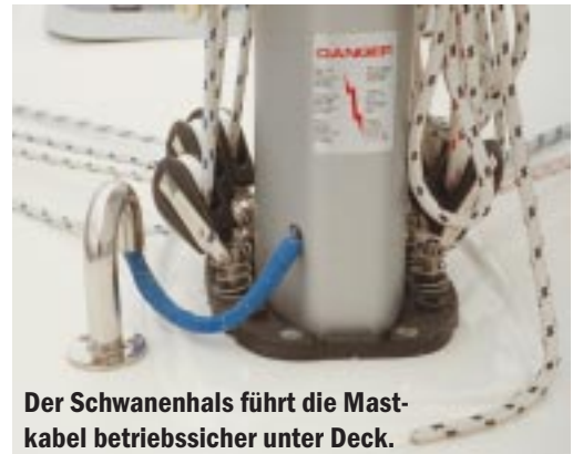
Der Schwanenhals führt die Mastkabel betriebssicher unter Deck.

Der Kartentisch am achteren Ende des Salons ist ausreichend groß. Dadurch, daß nach vorne hin kein Halbschott eingebaut ist, wirkt der Salon sehr geräumig; allerdings bleibt so nur begrenzt Raum für den Einbau von zusätzlichen Instrumenten. Der Sitz vor dem Tisch ist etwas zu hoch. Es bleibt bis unter das Seitendeck nur