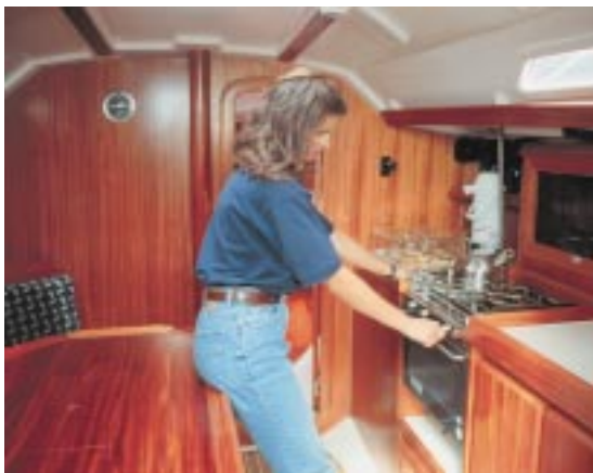
An der Pantry läßt sich auch auf See gut arbeiten.