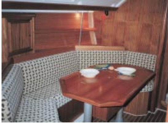
Der Salon ist mit einem gemütlichen U-Sofa ausgestattet, auf dem man allerdings nicht übernachten kann.