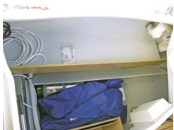
Die große Backskiste ist praktisch unterteilt

Ausgebaut ist das Schiff mit einem eichefurnierten Sperrholz. Ein wenig ungewöhnlich für Yachten, und so kann ich mich zunächst nicht