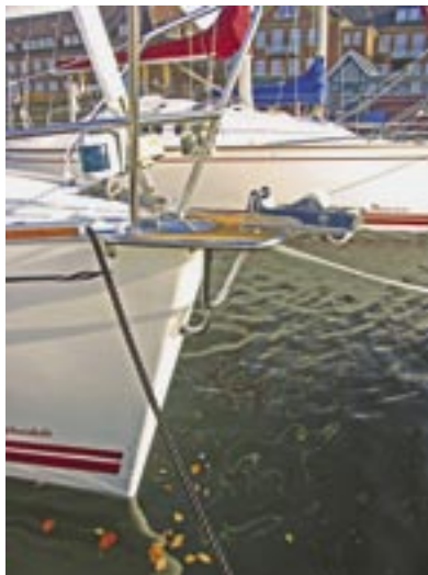
Am begehbaren Bugspriet wird der Anker gefahren