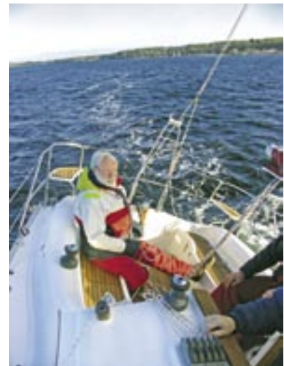
Bei zunehmender Krängung muss man kräftig an der Pinne ziehen

geteilte Steckschott zur Kajüte gestaut werden kann.