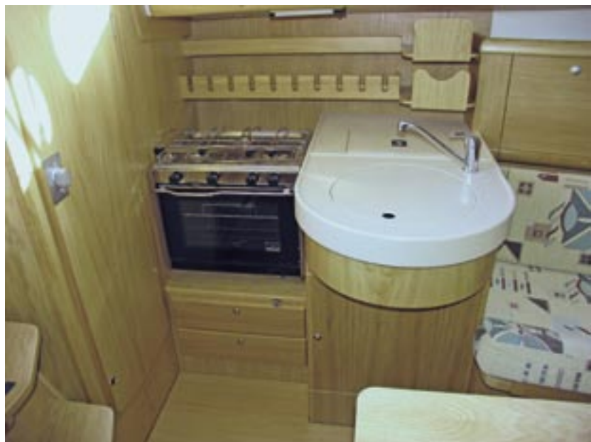
Der Kocher kann in eine Richtung nur zehn Grad ausschlagen

Der Motor ist mit einer konventionellen Wellenanlage mit Festpropeller ausgerüstet. Die Welle läuft gut geschützt in einem Tunnel bis weit nach achtern vor das Ruder, was den Manövriereigenschaften