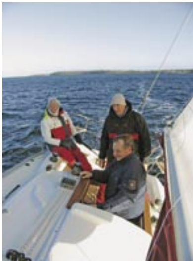
Im Niedergang steht es sich bequem

Stauraum gibt es reichlich in der großen unterteilten Backskiste, wo in einer Halterung das große un-