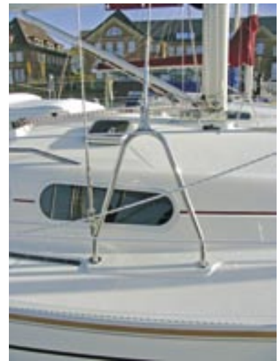
Die Bügel erleichtern das Mastlegen