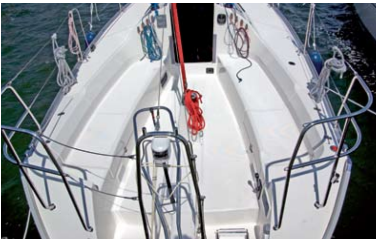
Das schnittige Cockpitdesign mit den achtern weit nach außen laufenden Duchten bietet viel Platz und erinnert an andere Skrzat-Entwürfe.

In puncto Interieur ergibt sich unterm Strich somit ein ambivalentes Bild: Der Ausbau repräsentiert einerseits erheblich mehr Fahrtenyachtstandard als die meisten waschechten „Rennziegen“ oder reinen Daysailer – zumal das Ganze zugleich Wohnlichkeit ausstrahlt und auch die Verarbeitung größtenteils in Ordnung geht – aber für eine vollwertige Tourenyacht fehlt es dann eben gerade mit Blick auf ausgedehntere Törns doch noch an der einen oder anderen Kleinigkeit. Hier sind insbesondere die fehlende Navigation sowie die unzureichenden Haltepunkte und Lüftungsmöglichkeiten zu nennen – die eben gerade auf längeren Fahrten, wenn es wettertechnisch zudem womöglich auch mal etwas rauer zugeht, von Bedeutung werden können.