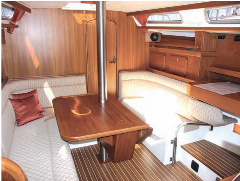
Der Salon ist sorgfältig ausgebaut und bietet dank des längs eingebauten Navigationstisches ausreichend Bewegungsraum

Ausgerüstet ist das Schiff mit einem zweiflügeligen Faltpropeller, der beim Aufstoppen relativ gut greift. Ein wirksamerer Dreiflügler ist gegen Aufpreis zu haben. Das Schiff reagiert bei Rückwärtsfahrt etwas spät, aber genau, und der Drehkreis liegt eben über einer Schiffslänge. Obwohl der Propeller relativ weit vor dem Ruder sitzt, wird es durch den Propellerstrom wirksam angeströmt. Das Schiff reagiert auch ohne Fahrt durchs Wasser und bei voraus drehendem Propeller gut.