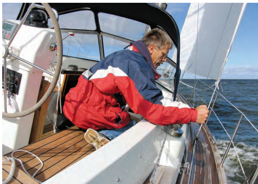
Von achtern verstellbare Holepunkte und die richtige Winschengröße helfen beim Trimmen der Rollgenau

Wenn man die Schiebeluke zur Ka-jüte hin aufschiebt, fällt einem die Leichtgängigkeit auf. Die Werft hat ein selbstschmierendes Kunststoffprofil so gefräst, dass die Plexiglasluke mit der Teakholzblende reibungsarm darin läuft. Nachdem man den sicheren Niedergang hinuntergegangen ist, kommt man in einen zunächst relativ kurz erscheinenden Salon: Durch die Mittelcockpitbauweise reicht der Raum nicht weit nach vorne. Aber nach achtern ist aus-reichend Platz, um die Pantry unter dem Backbordseitendeck gekonnt zu integrieren. Dadurch, dass kein ►