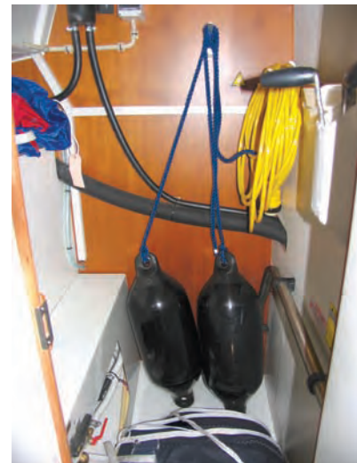
Die begehbbare Backskiste bietet viel Platz und ist gut zugänglich