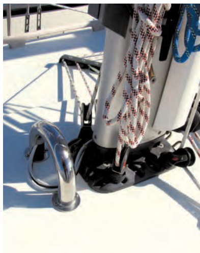
Runder Schwanenhals: Hier kann nichts hängenbleiben

Auch aus seemännischer Sicht stimmt das Decks-konzept: Die Fußreling ist hoch genug, um den Füßen auch wirklich Halt zu geben. Das Vorschiff ist breit genug, um auch bei rauher See sicher arbeiten zu können, und es gibt große Handläufe und Beschläge, in denen Gurte für Sicherheitsleinen angeschlagen werden können. Die Klampen sind groß genug, und mittschiffs gibt