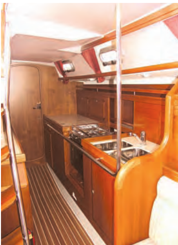
Die Pantry liegt im Durchgang nach achtern unter dem Cockpit

Bei Achtercockpityachten ist der Platz zum Einbau der Maschine beschränkt, bei einer Mittelcockpityacht steht zumeist der gesamte Raum unter der Cockpitwanne zur Verfügung. So hat man auch bei der C-Yacht einen Motorraum eingebaut, der diese Bezeichnung wahrlich verdient. In dem beleuchteten Raum ist der Dreizylinder Yanmar so untergebracht, dass er von drei Seiten und von oben gut erreichbar ist. Seine Steuerbordseite ist sogar wartungsfreundlich über die Backskiste zugänglich. Hier befinden sich auch die Starterbatterien und das Steuergestänge mit seiner Umlenkung aus der Steuersäule heraus nach achtern. Weiter vorne sind das Ladegerät und die Hauptverteilung der Stromversorgung in einem separaten Raum untergebracht.