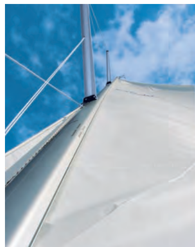
Das Rollgroß steht schlecht

versenkt, damit man sich nicht ver-letzt und sich nichts verhakt. Dabei fällt wieder ein besonderes Detail auf: Die Rollen zum Umlenken der Leine des Fockrollers sind am Fuß der Relingstütze integriert und mit Kugellagern ausgerüstet.