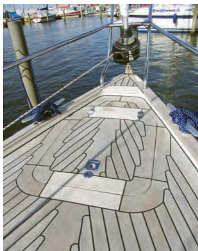
Aufwendig gearbeitetes Teakdeck

es Springklampen, an denen auf der Teakleiste VA-Profile als Scham-filschutz aufgeschraubt sind. Auf Deck sind die Beschläge sorgfältig