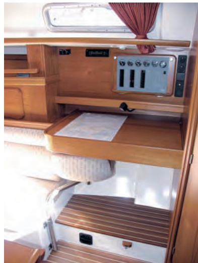
Der Hocker in der Navigationsecke kann ausgefahren werden