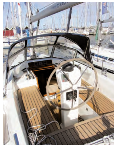
Geschütztes Cockpit mit fester Scheibe

es Springklampen, an denen auf der Teakleiste VA-Profile als Scham-filschutz aufgeschraubt sind. Auf Deck sind die Beschläge sorgfältig