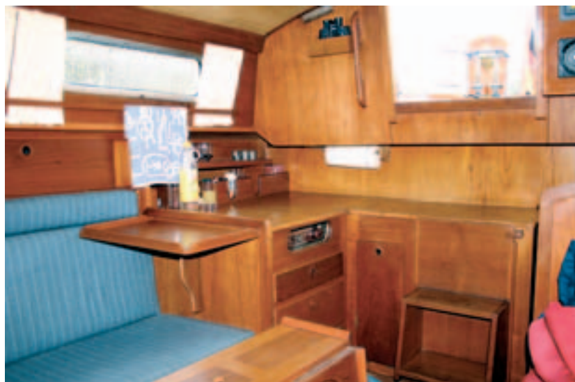
Die Pantry ist groß, funktionell und kann bei Nichtgebrauch mit Abdeckungen verschlossen werden

ligatorische V-Koje, die mit einer Länge von 2,15 Metern, gemessen bis in die Spitze, auch für zwei Erwachsene ausreichend ist. Durch ein einzusetzendes Dreieck zwischen den Kojen kann das komplette Vorschiff zur Schlaffläche umfunktioniert werden.