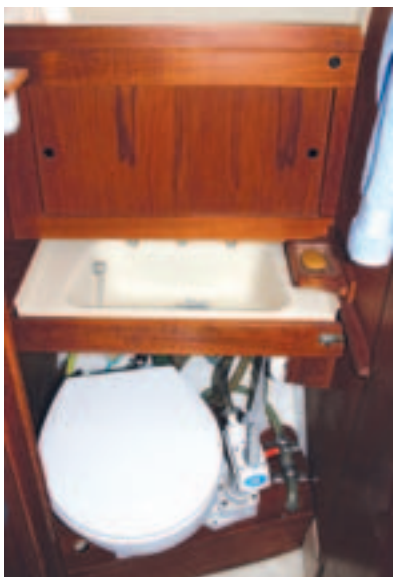
Das Waschbecken wird zum Gebrauch herausgezogen