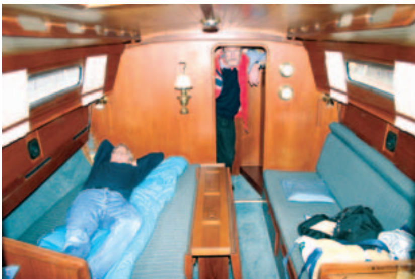
Im großen Salon können die Sofas zu breiten Kojen umfunktioniert werden

Zum Vorschiff geht es durch eine Schiebetür, die ein an Backbord liegendes WC und einen an Steuerbord eingebauten Schrank vom ►