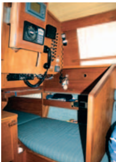
Der Kartentisch kann unter das Cockpit geschoben werden

Salon abteilt. Im WC-Raum ist ein ausziehbares Waschbecken untergebracht, welches bei Bedarf einfach zur Bordwand hin weggeschoben wird. Alternativ wurde von der Werft eine Version geliefert, bei der statt des Schrankes ein fest eingebautes Waschbecken mit Waschtisch und einem kleinen Schrank darüber vorhanden sind. Da das daβ Vorschiff ebenfalls mit einer Klapptür abgetrennt ist, entsteht so ein kleiner WC-Raum, wobei es fraglich ist, ob eine solche Einrichtung auf einer 28-Fuß-Yacht sinnvoll ist. Hier muss jeder Segler selbst entscheiden, was er im täglichen Leben an Bord benötigt.