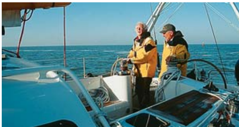
Viel Platz im Cockpit, die Schotwinschen sind sehr gut platziert. Stabile Handläufe am Doghaus machen das Arbeiten an Deck sicherer