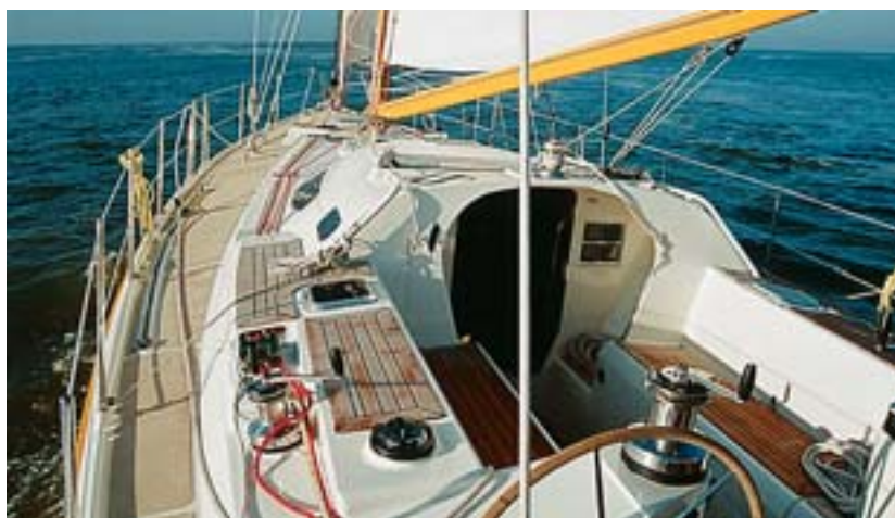
Die nach achtern geführten Fallen laufen teilweise verdeckt, die Fallwinschen sind leider ungünstig platziert

Über eine Stufe gelangt man in das mittlere Cockpit mit zwei Duchten in Liegелänge und nach außen hin sehr breiten Cockpitsüßen. Darunter laufen teilweise verdeckt die Fallen und Strecker auf zwei Winschen, die leider für eine bequeme Bedienung zu weit außen sitzen. Dafür befinden sich die Hauptwinschen umso besser erreichbar zwischen dem mittleren und dem achteren Cockpitteil auf zwei Sockeln. Die beiden Andersen 58 ST können elektrisch bedient werden. Ganz achtern befinden sich die zwei Steuerräder, die mit einer Witlock -Anlage mit den beiden Rudern verbunden sind. Ein großer Sicherheitsfaktor besteht darin, dass ein eventuell beschädigtes Ruderblatt von der Anlage abgekoppelt und das Schiff mit einem Ruder weitergesteuert werden kann. ▶